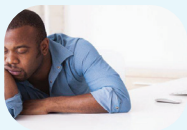
Merasa lemas atau lelah