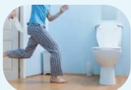
Sering buang air kecil