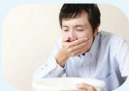
Mual dan/ atau muntah